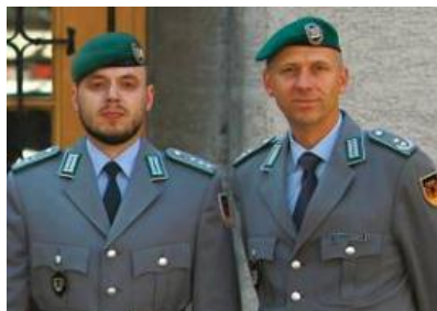
Nicht nur der Stabszug (Seite 29) bekam einen neuen Chef – auch die siebte Kompanie (Seite 11).