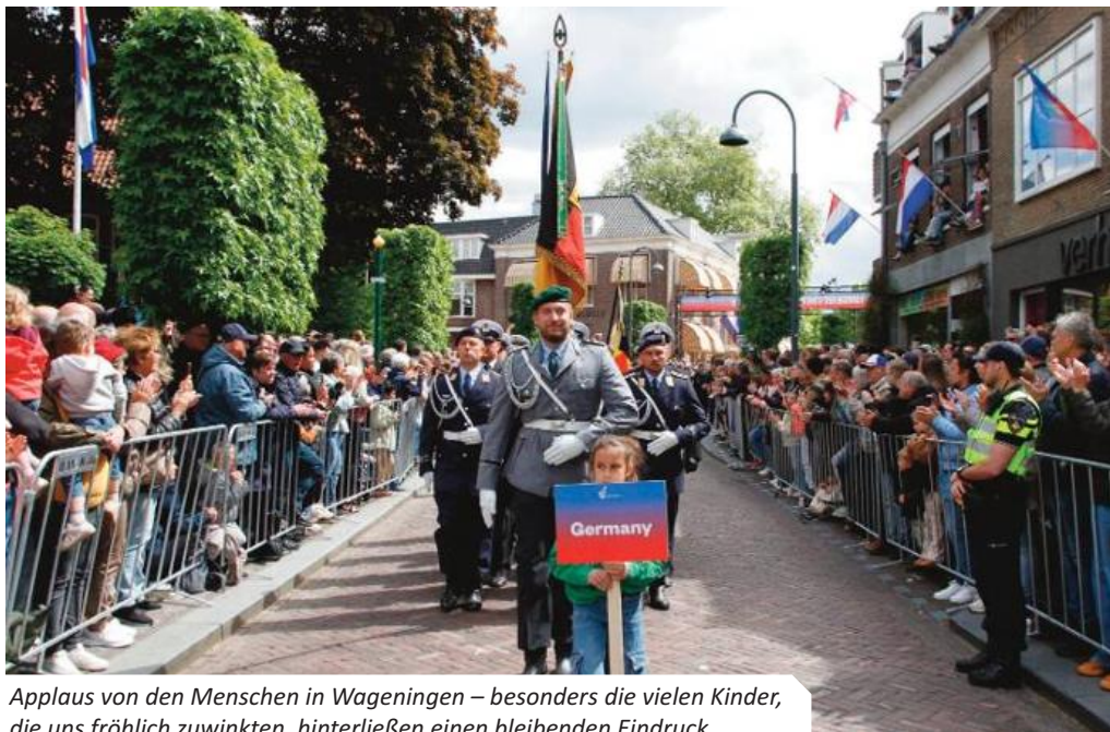
Applaus von den Menschen in Wageningen – besonders die vielen Kinder, die uns fröhlich zuwinkten, hinterließen einen bleibenden Eindruck.

Die Feierlichkeiten zum 80. Befreiungstag im niederländischen Wageningen