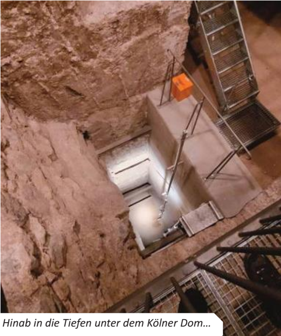
Hinab in die Tiefen unter dem Kölner Dom...

gebracht. Angesicht der bemerkenswerten Gesamtbauzeit von 632 Jahren besticht der Kölner Dom durch seinen einheitlichen Entwurf.