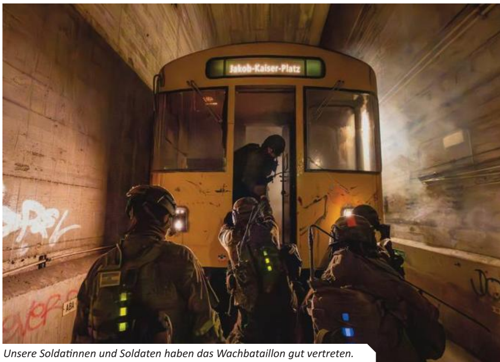
Unsere Soldatinnen und Soldaten haben das Wachbataillon gut vertreten.

ren, mit zivilen Stellen und anderen Institutionen fördert das Durchdringen bestehender Strukturen. Mit Vorbefehlen werden die Erwartungen an die Übung weitergegeben. Wer die Idee hinter der Übung verstanden hat, bewegt sich also auch weit vor der Übung selbst, mit wachem Auge durch die Großstadt. Beschäftigt sich beim wöchentlichen Pendeln mit städtischen Gegebenheiten und im täglichen Stau am Dreieck Funkturm mit der Frage, wie ein taktisches Handeln nun realisiert werden könnte.