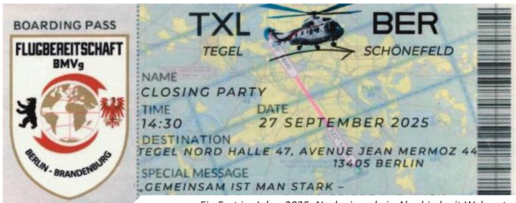
Ein Fest im Jahre 2025: Noch einmal ein Abschied mit Wehmut...