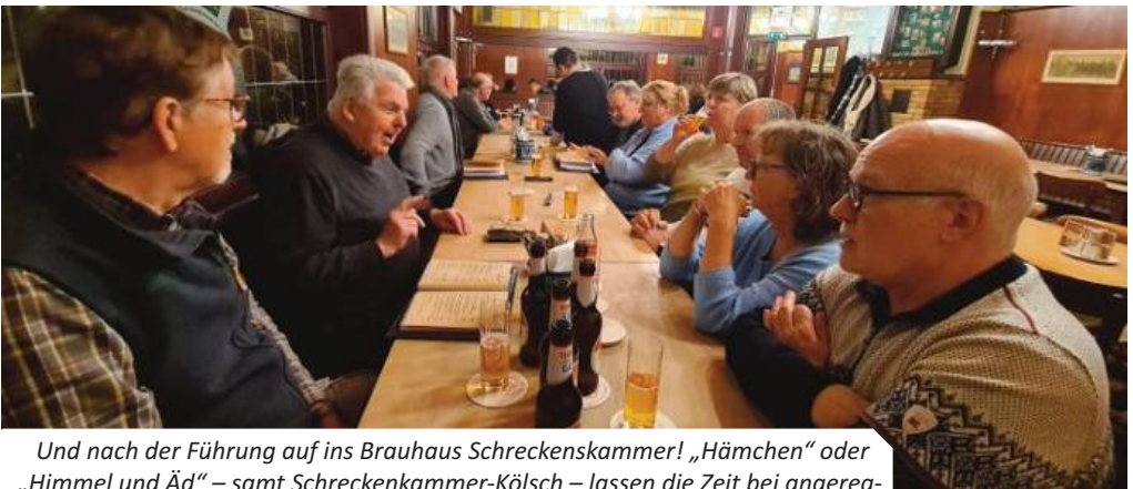
Und nach der Führung auf ins Brauhaus Schreckenkammer! „Hämchen“ oder „Himmel und Äd“ – samt Schreckenkammer-Kölsch – lassen die Zeit bei angeregten Gesprächen und entsprechendem Lärmpegel wie im Fluge vergehen.

des Alten Doms erläutert und die gefundenen Sarkophage erklärt. Wir sahen den Abdruck verschiedener Fliesenformen im Mörtelbett – sie wurden vorsichtig herausgebrochen und an anderer Stelle wiederverwendet. Auch wurde uns verdeutlicht, dass beim Bau des Alten