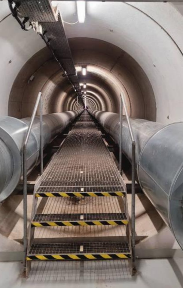
Unendliche Weiten: Der Fernwärmetunnel 25 Meter unter dem Rhein ist Versorger für Haushalte und Unternehmen in Kölns Stadtteil Deutz – die rechtsrheinische „Schäl Sick“.

wieder den Tunnel verlassen hatten. Dann wurden wir aufgefordert, die gut 100 Gitterroststufen bis zum Boden des Einstiegsschacht hinabzusteigen. Hier wurden wir von einem Mitarbeiter der RheinEnergie empfangen, der uns ausführlich und anschaulich über das Fernwärmenetz und den Bau des Fernwärmetunnels informierte und uns anschließend durch den Tunnel begleitete. Die RheinEnergie betreibt in Köln an vier Standorten – in Mer-