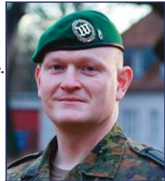
Ehrgeizig, wissbegierig und perfektionistisch.

Colonel John „Hannibal“ Smith aus der Kultserie „Das A-Team“. War die Lage noch so ausweglos – er hätte immer eine passende, wenn auch zumeist komplexe und ungewöhnlich Idee, die Situation zu seinen Gunsten wenden zu können. Natürlich auch immer mit dem passenden, immer wiederkehrenden Spruch am Ende: „Ich liebe es, wenn ein Plan funktioniert.“