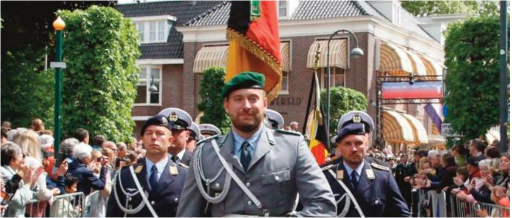
Die ersten deutschen Soldaten, die offiziell an den Feierlichkeiten zum Befreiungstag im niederländischen Wageningen teilnahmen: 15 Kameraden aus der vierten Kompanie des Wachbataillons (Seite 42).