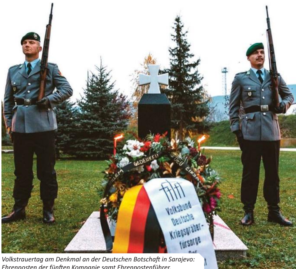
Volkstrauertag am Denkmal an der Deutschen Botschaft in Sarajevo: Ehrenposten der fünften Kompanie samt Ehrenpostenführer.

Jedes Jahr wird im November an einem bestimmten Tag der Opfer von Krieg und Gewalt gedacht. Dieser Tag ist der bundesweite Volkstrauertag, welcher stets an einem Sonntag zwei Wochen vor dem ersten Adventssonntag stattfindet. Als Protokollsoldat der fünften Kompanie ist man gewohnt, beispielsweise am Ehrenmal der Bundeswehr auf dem Gelände des Verteidigungsministeriums oder an der Neuen Wache in Berlin-Mitte zu stehen. Aus diesem Grund war ich umso überraschter, als