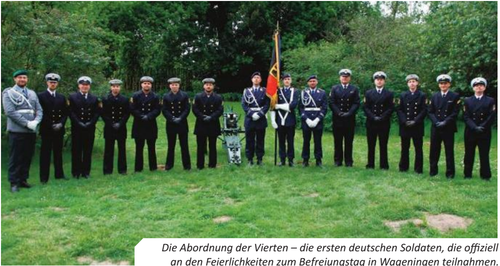
Die Abordnung der Vierten – die ersten deutschen Soldaten, die offiziell an den Feierlichkeiten zum Befreiungstag in Wageningen teilnahmen.

daten und Veteranen verschiedener Nationen sowie mit zahlreichen interessierten Zivilisten. Besondere Bedeutung erhielt unser Einsatz dadurch, dass deutsche Soldaten erstmals überhaupt offiziell an den Feierlichkeiten zum Befreiungstag in Wageningen teilnahmen. Dieser historische Schritt wurde durch Lautsprecherdurchsagen während der Parade besonders hervorgehoben. Mehrere Medienvertreter – sowohl aus den Niederlanden als auch von internationalen Sendern – nutzten die Gelegenheit, Interviews mit mir und weiteren Angehörigen unserer Abordnung zu führen.