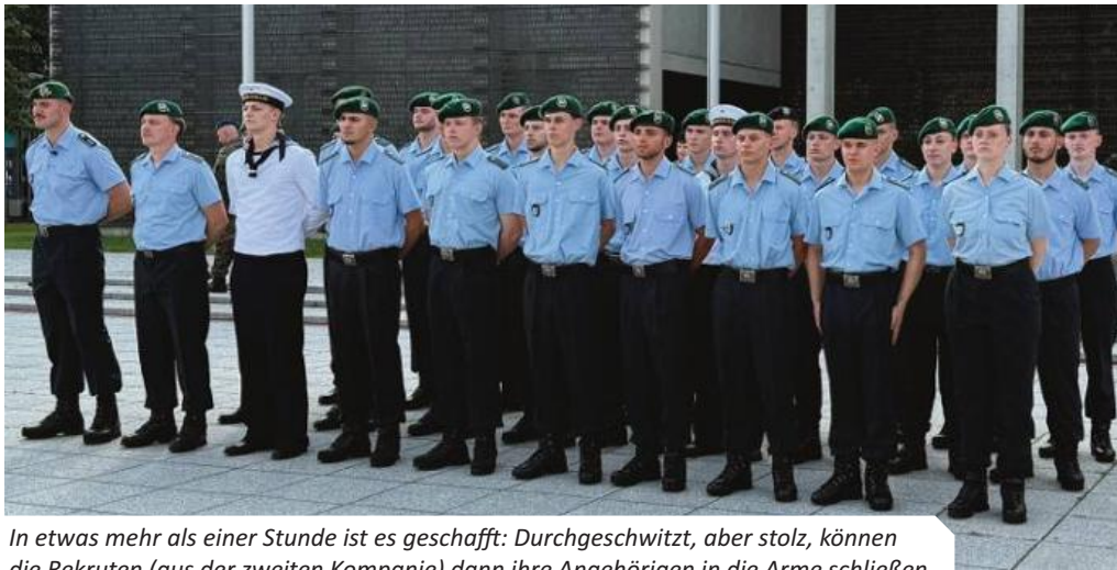
In etwas mehr als einer Stunde ist es geschafft: Durchgeschwitzt, aber stolz, können die Rekruten (aus der zweiten Kompanie) dann ihre Angehörigen in die Arme schließen.

nur nehmen unsere Rekruten an diesem Ereignis teil – sondern das Wachbataillon stellt mit seinem Kommandeur als Führer der Formation die Ehrenformation der Bundeswehr.