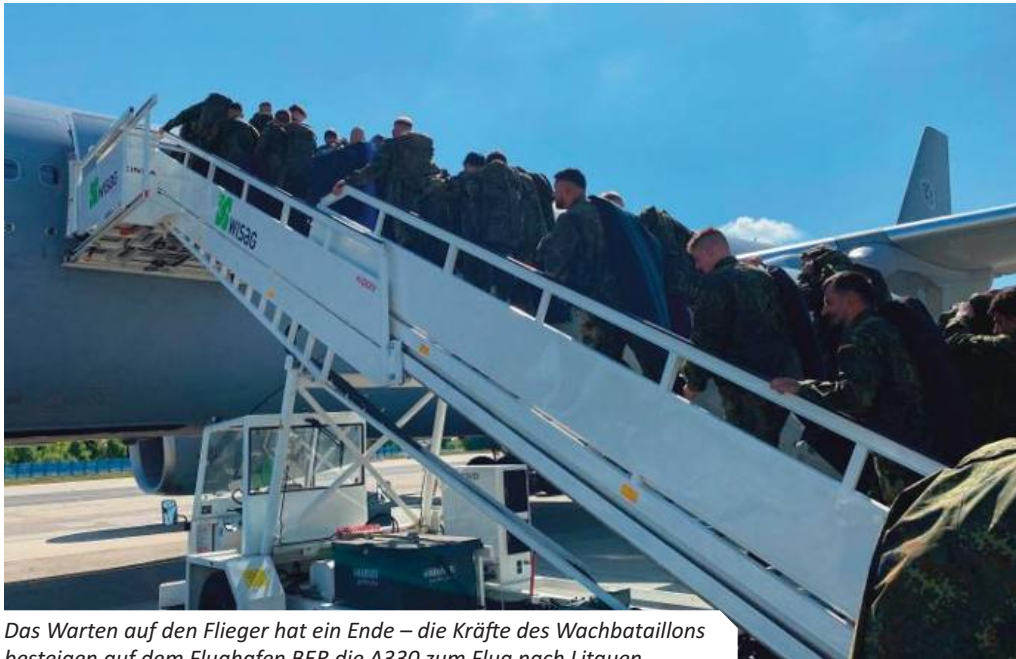
Das Warten auf den Flieger hat ein Ende – die Kräfte des Wachbataillons besteigen auf dem Flughafen BER die A330 zum Flug nach Litauen.

Das Wachbataillon beim Aufstellungsappell der Panzerbrigade 45 in Litauen