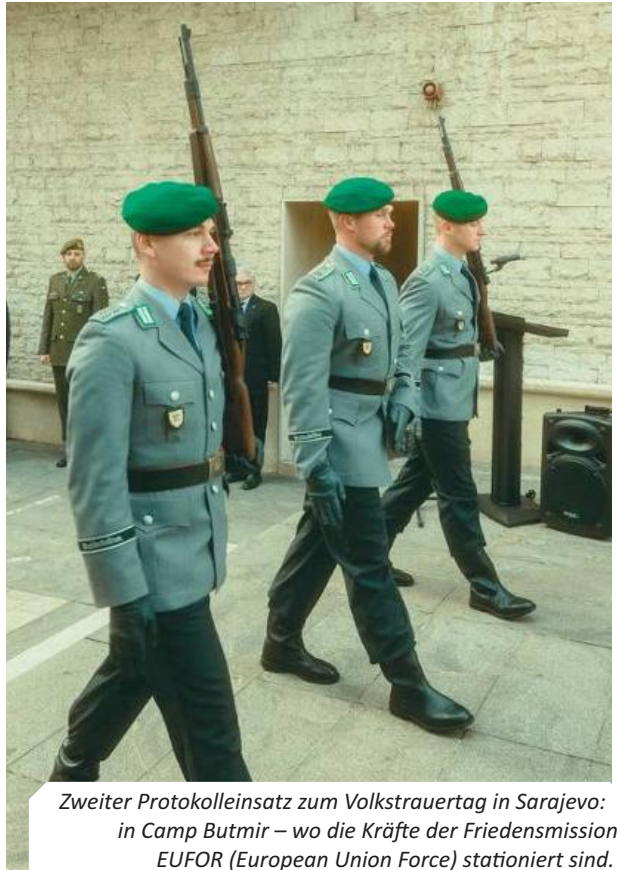
Zweiter Protokolleinsatz zum Volkstrauertag in Sarajevo: in Camp Butmir – wo die Kräfte der Friedensmission EUFOR (European Union Force) stationiert sind.