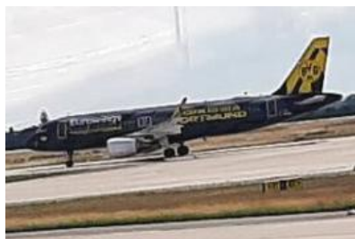
Zwei Garde-Flughäfen werden beschrieben (auf Seite 18 und auf Seite 22) – darunter einer sehr liebevoll.