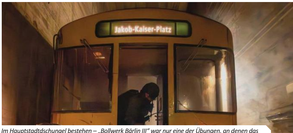
Im Hauptstadtschungel bestehen – „Bollwerk Berlin III“ war nur eine der Übungen, an denen das Wachbataillon beteiligt war: auf Seite 45 und aus Sicht des Kommandos Feldjäger auf Seite 49.