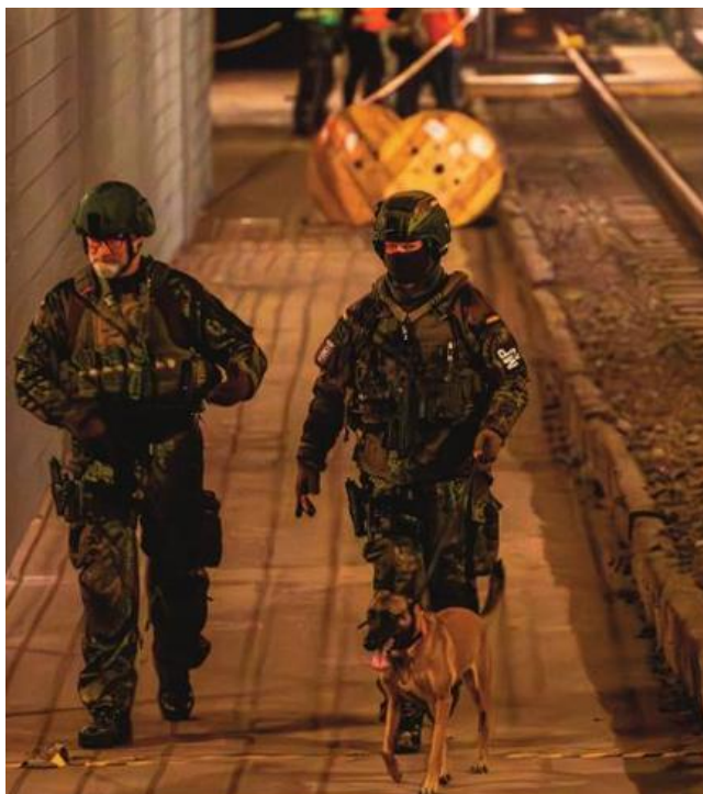
Wachbataillon und Feldjäger wachsen zusammen: Feldjäger mit Diensthund bei der Übung „Bollwerk Bärln III“.

Zielgerichtete Personalbindungsprogramme, verstärkte Werbemaßnahmen und eine deutliche Erhöhung der Einstellungsumfänge (eingebettet in die Task Force 130 Prozent) wirkten gemeinsam stabilisierend. Auch die Verlängerung der Mindestverpflichtungszeiten für Freiwillig Wehrdienstleistende hat zur Verbesserung der Situation beigetragen. Heute zeigt sich das Bild einer deutlich entspannteren und verlässlich planbaren Personalstärke.