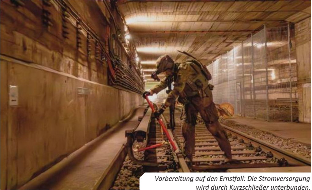
Vorbereitung auf den Ernstfall: Die Stromversorgung wird durch Kurzschließer unterbunden.

Ausbildung füllt aber lediglich den geistigen Werkzeugkasten der Führungskräfte und Angehörigen des Verbandes. Die Fähigkeit, den gefüllten Werkzeugkasten einzusetzen, wird nur dann erreicht, wenn Bilder gestellt werden. Bilder, die auf die Realität einer militärischen Auseinandersetzung ausgerichtet sind: abgeleitet von Erfahrungswerten aktueller Konflikte und übertragen in den Einsatzraum des Verbandes.