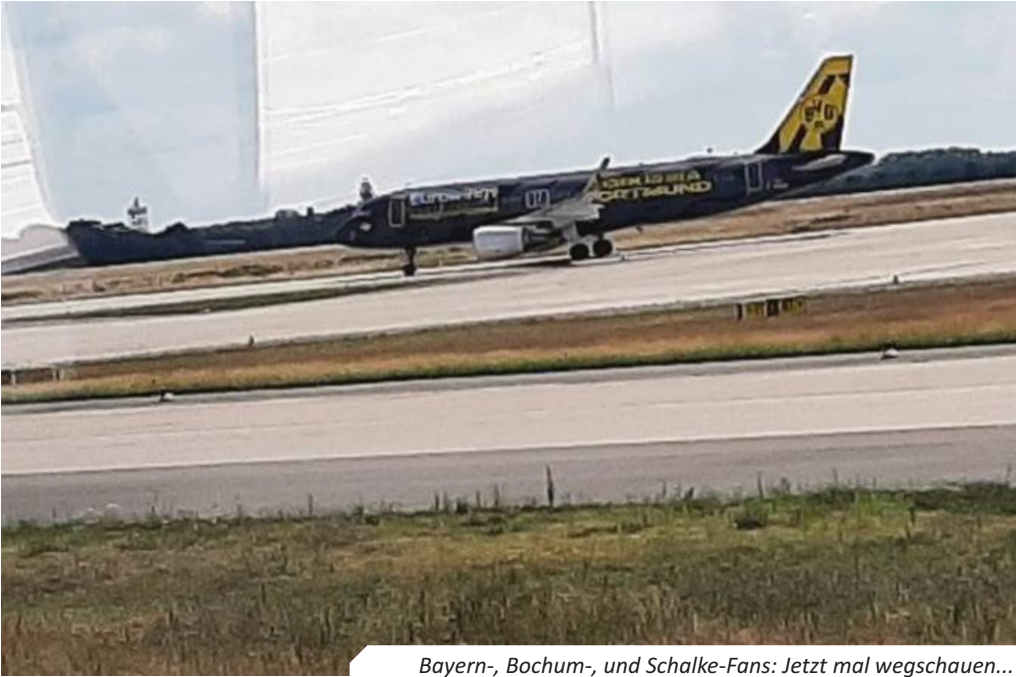
Bayern-, Bochum-, und Schalke-Fans: Jetzt mal wegschauen...

vorbei. Unbeirrt von einem Bundeswehrbus, wurden die Maschinen weiter abgefertigt. Und für unseren Busfahrer galten auf einmal andere Regeln. Im Straßenverkehr immer der große dicke Bus, vor dem Autofahrer Respekt zeigen, musste er sich nun den Flugzeugen unterordnen. Flugzeuge haben immer Vorfahrt auf dem Vorfeld.