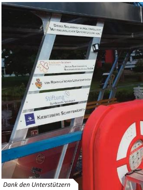
Dank den Unterstützern