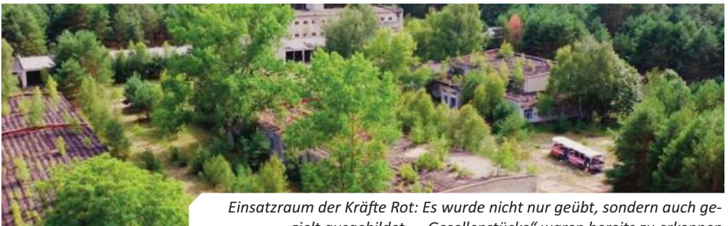
Einsatzraum der Kräfte Rot: Es wurde nicht nur geübt, sondern auch gezielt ausgebildet – „Gesellenstücke“ waren bereits zu erkennen