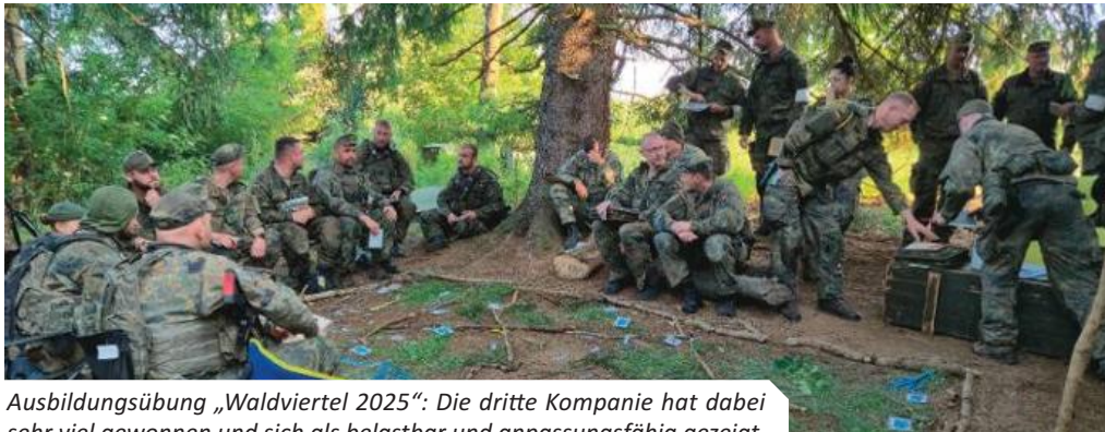
Ausbildungsübung „Waldviertel 2025“: Die dritte Kompanie hat dabei sehr viel gewonnen und sich als belastbar und anpassungsfähig gezeigt.

Die Dritte kämpft bei „Waldviertel 2025“ gegen mechanisierten Feind