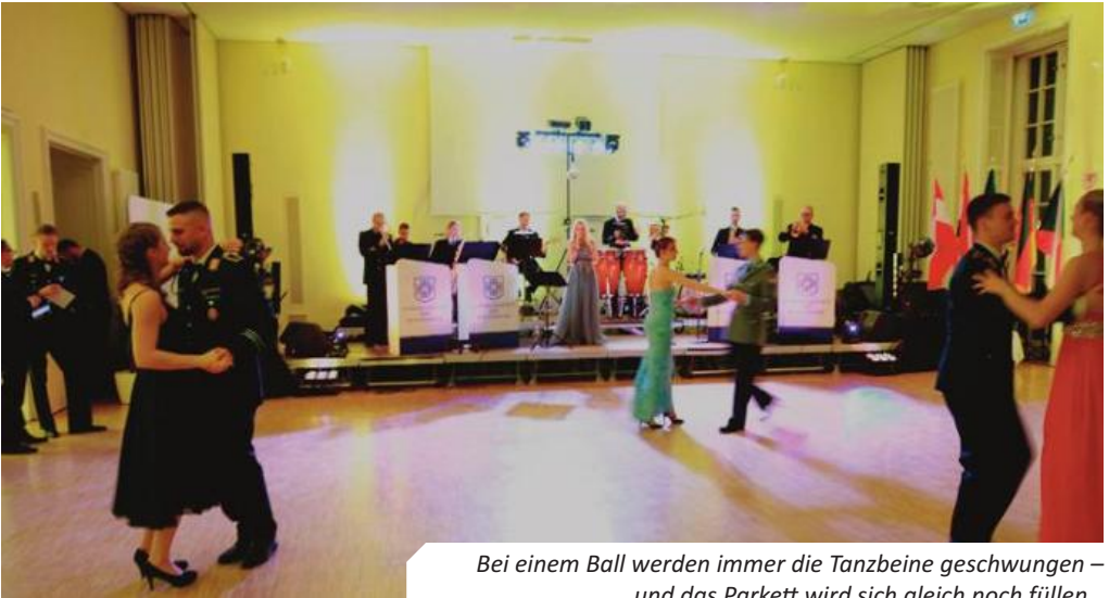
Bei einem Ball werden immer die Tanzbeine geschwungen – und das Parkett wird sich gleich noch füllen...

an Speisen und Getränken trug zum gelungenen Gesamtbild bei. Als weiteres Highlight stellte ein Drillteam sein Können unter Beweis und begeisterte die Gäste – dicht gefolgt von der vom Verpflegungstrupp des Wachbataillons eigens errichteten Torte, die von den Gästen im Anschluss genüsslich verzehrt werden durfte. Der geplante Zapfenstreich von 02:00 Uhr nachts wurde heiter tanzend um eine Stunde verlängert.