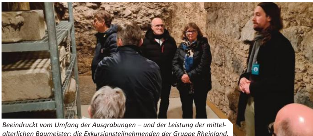
Beeindruckt vom Umfang der Ausgrabungen – und der Leistung der mittelalterlichen Baumeister: die Exkursionsteilnehmenden der Gruppe Rheinland.

Im Jahr 2024 hatten wir den Innenraum und die Schatzkammer des Kölner Doms besichtigt und den Abend im Brauhaus Schreckenskammer ausklingen lassen ( Gardist Heft 02/2024). Schon damals waren wir uns einig: „Das machen wir noch einmal!“ So luden wir zum 20. November 2025 zu unserer Exkursion ein – wahlweise: „Führung durch die Ausgrabungen unter dem Kölner Dom“ oder „Führung durch das Dach des Kölner Doms“.