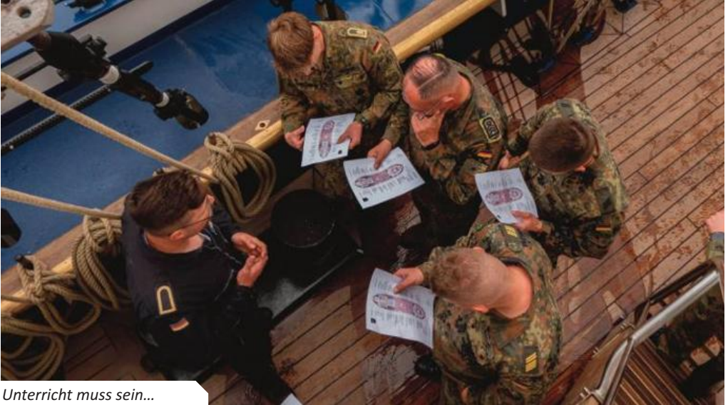
Unterricht muss sein...

zieranwärterinnen und Offizieranwärter auch in einem schriftlichen Leistungsnachweis abgeprüft wurden. Parallel dazu mussten ein Seesack genäht, 16 seemannische Knoten beherrscht sowie jeder einzelne Nagel an Bord auswendig gelernt werden; es war in den ersten Tagen auf See also permanent etwas zu tun.