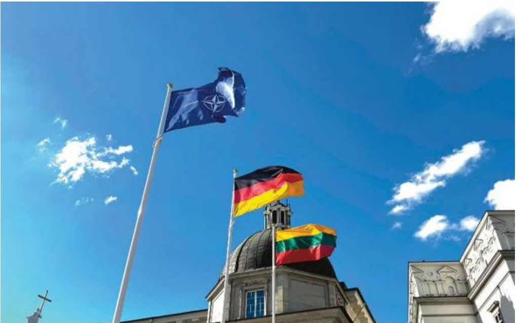
Die Flaggen der zentralen Akteure nebeneinander auf dem Domplatz: NATO, Deutschland, Litauen.

von den mitgereisten Protokollfeldwebeln ausgebildet. Mit allen Kräften gemeinsam ging es dann in die Stadt zum Vorüber. Dabei ist uns vor allem der Kontrast zwischen dem ländlichen, noch an eine andere Zeit erinnernden Litauen und dem hochmodernen Vilnius aufgefallen, wo hohe Bürotürme gen Himmel ragen. Das Vorüber, inklusive Stellprobe und mehrmaligen Ein- und Ausmarsches, hat bis