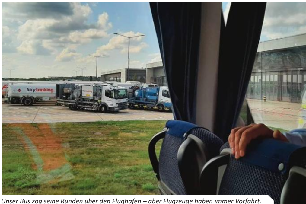
Unser Bus zog seine Runden über den Flughafen – aber Flugzeuge haben immer Vorfahrt.

sichtigung startete. Nach dem Besuch der „Verteilerebene“ (hier kommen bis zu 400 Passagiere vom unterirdischen Bahnhof gleichzeitig an) sahen wir in der Ankunft „Nord“ die Kunst am Bau. Von allen Ländern nördlich des Äquators wurden hier Münzen in den italienischen Marmorboden eingelassen. Und endlich erfuhren wir, warum es nicht möglich ist, diese Münzen zu entfernen. Schade eigentlich. Im Anschluss besichtigten wir die Check-in Halle. Als Vielflieger muss ich sagen: nie genutzt, und doch ständig im Umbau. Wer gibt heutzutage noch sein Gepäck am Schalter auf oder hat eine Papierbordkarte? Daher gibt es immer mehr Self-Check-in Schalter, und so konnte nun auch Platz geschaffen werden für die zukünftige „Champagnerbar“. Leider erst Eröffnung in einer Woche nach unserem Besuch.