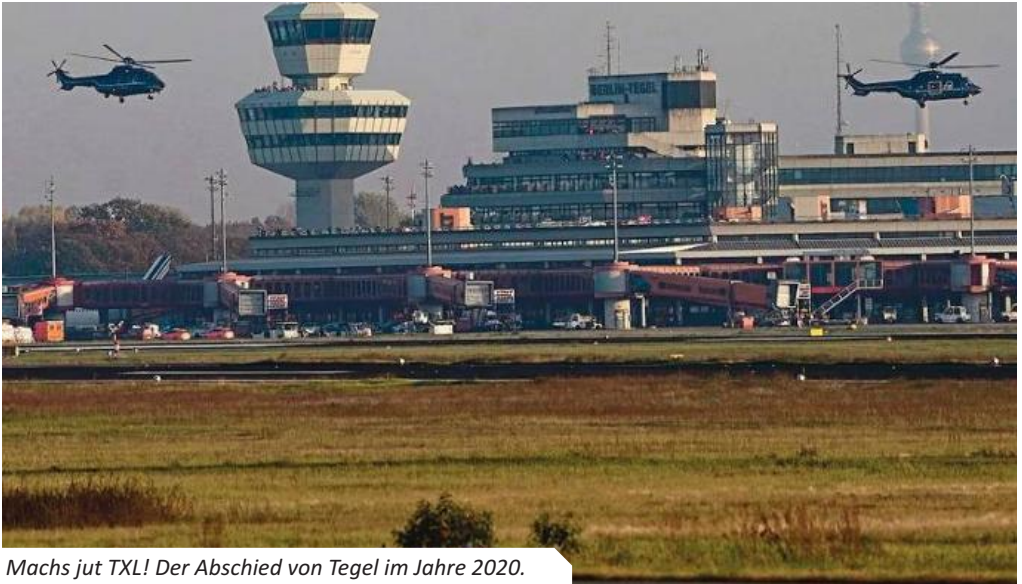
Machs jut TXL! Der Abschied von Tegel im Jahre 2020.

Am 27. September 2025, an einem Samstag, verabschiedete sich die Lufttransportgruppe der Flugbereitschaft beim