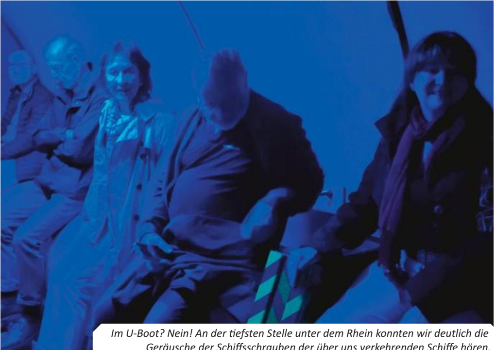
Im U-Boot? Nein! An der tiefsten Stelle unter dem Rhein konnten wir deutlich die Geräusche der Schiffsschrauben der über uns verkehrenden Schiffe hören.

und fräste sich mit ihrem riesigen Bohrschild Meter für Meter unter dem Rhein hindurch: gesteuert durch Lasertechnik. So konnte sie exakt auf Kurs gehalten werden und traf im Oktober 1985 zentimetergenau den Schacht auf der linken Rheinseite – der heute, genau wie sein Gegenüber, als Tunnelzugang dient. Auf der 461 Meter langen Strecke unter dem Rhein musste die Maschine jedoch immer wieder gestoppt werden, da die Arbeiter auf Gesteinsbrocken und Bruchstücke der im Zweiten Weltkrieg zerstörten Hohenzollernbrücke oder auf Bombensplitter stießen. Aber im Tagesdurchschnitt schafften sie immerhin 2,76 Meter. Der Außendurchmesser der Tunnelröhre beträgt 3,60 Meter, der Innendurchmesser 3,00 Meter. Das bedeutet, dass die Wanddicke 0,30 Meter beträgt. Rund 2.500 LKW-Ladungen Erdreich fielen beim Tunnelbau als Abraum an.