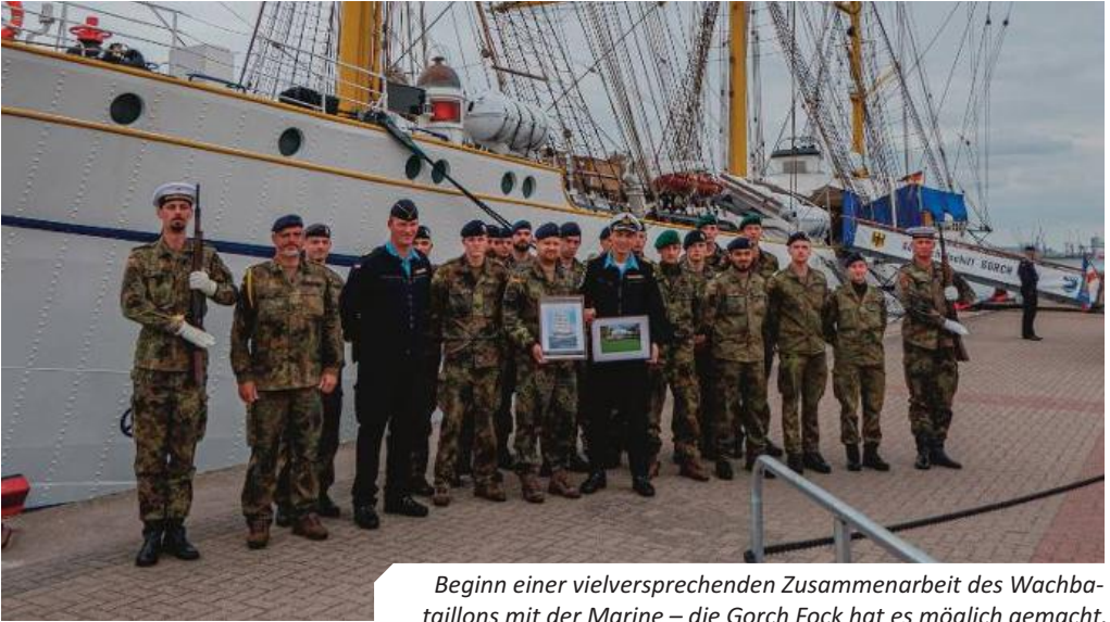
Beginn einer vielversprechenden Zusammenarbeit des Wachbataillons mit der Marine – die Gorch Fock hat es möglich gemacht.

Marine – wie auch architektonische Meisterwerke in Hafennähe, die viele von uns ins Staunen versetzen konnten.