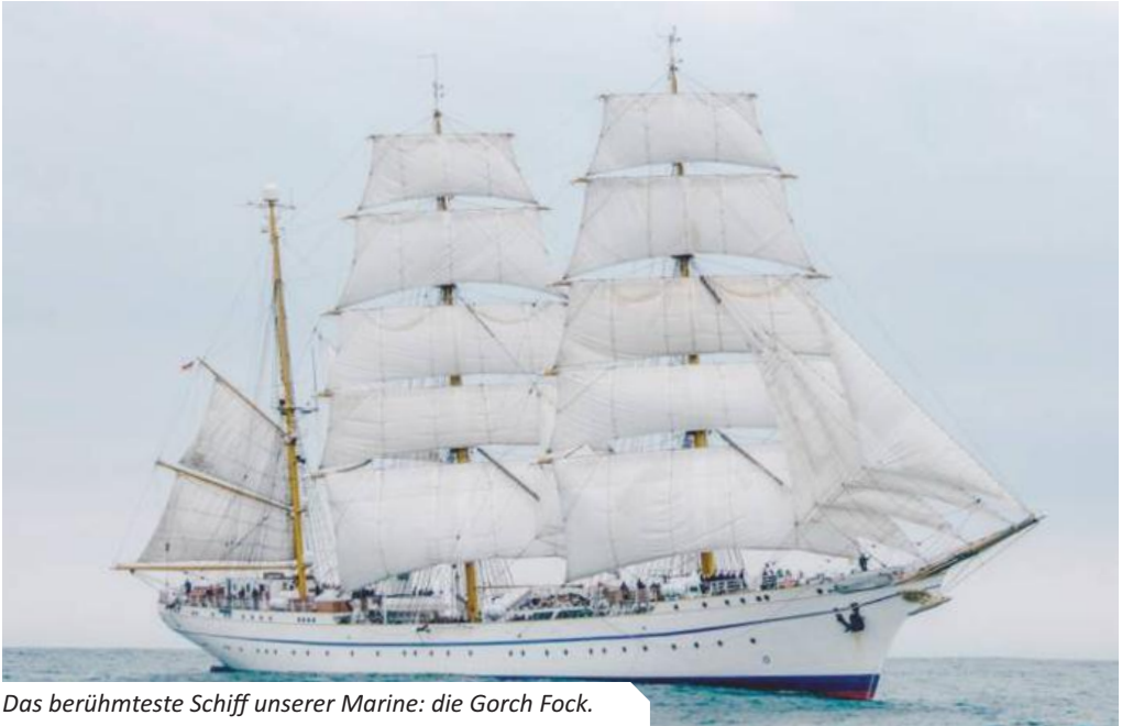
Das berühmteste Schiff unserer Marine: die Gorch Fock.

Die Marinekompanie lernt auf der Gorch Fock