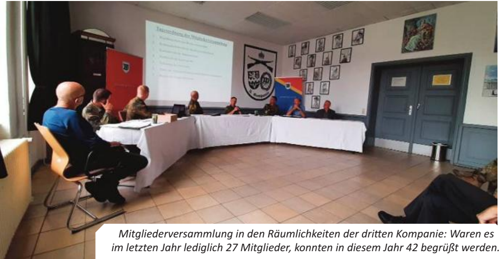
Mitgliederversammlung in den Räumlichkeiten der dritten Kompanie: Waren es im letzten Jahr lediglich 27 Mitglieder, konnten in diesem Jahr 42 begrüßt werden.

eines neuen Bundesgeschäftsführers notwendig. Zuvor trug er den anwesenden Mitgliedern seinen Rechenschaftsbericht vor. Die Kassen- und Prüfberichte wurden durch den Schatzmeister vorgestellt. Auf Antrag des Kassenprüfers wurde der Vorstand für das vergangene Haushaltsjahr entlastet.