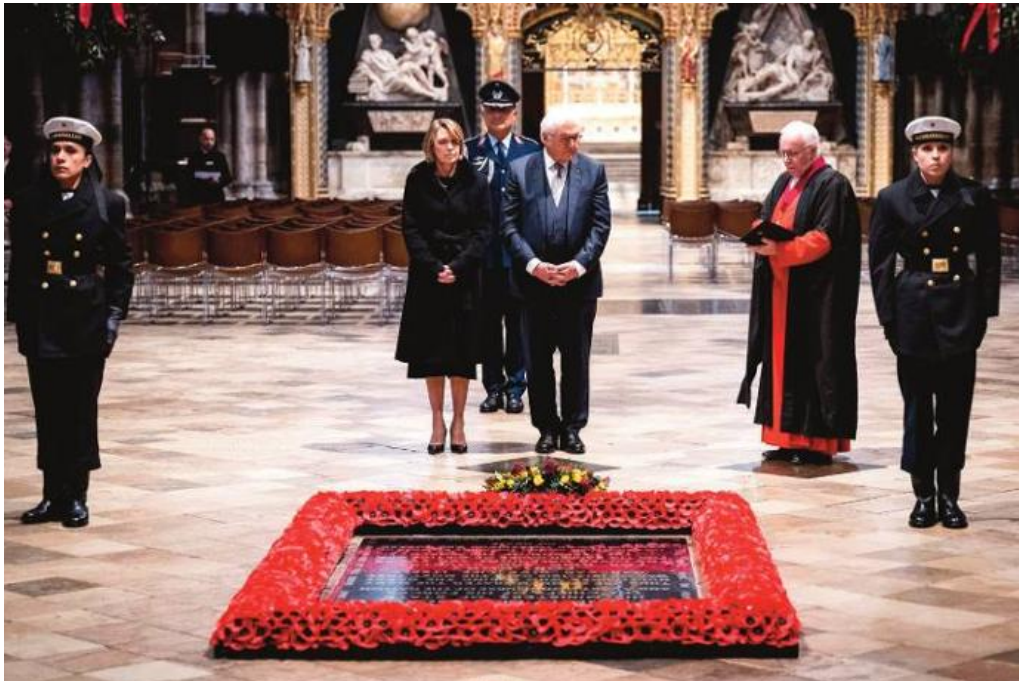
Einsatz an historischem Ort: Kranzniederlegung mit dem Bundespräsidenten in der Westminster Abbey.

Kranzniederlegung in der Westminster Abbey in London – mit Bundespräsident Frank-Walter Steinmeier