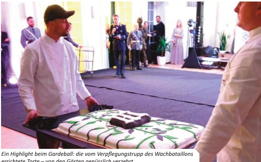
Ein Highlight beim Gardeball: die vom Verpflegungstrupp des Wachbataillons errichtete Torte – von den Gästen genüsslich verzehrt.

Eine Mischung aus Eleganz, Traditionen und militärischem Ambiente