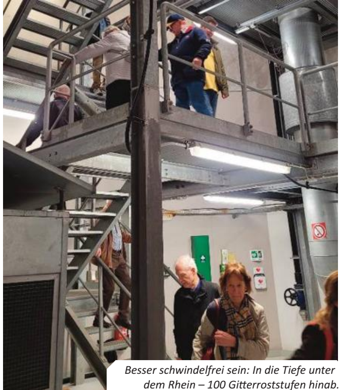
Besser schwindelfrei sein: In die Tiefe unter dem Rhein – 100 Gitterroststufen hinab.

So sind sowohl beim Einstieg wie auch beim Ausstieg circa 100 Gitterroststufen zu überwinden. Leider haben diese Voraussetzungen einige Kameraden davon abgehalten, an die-