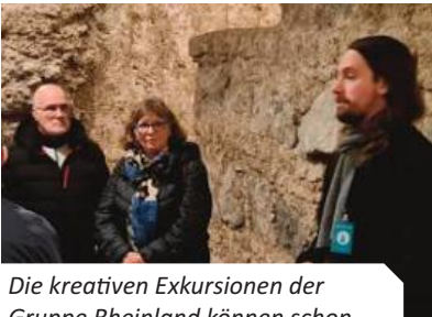
Die kreativen Exkursionen der Gruppe Rheinland können schon manchmal sehr in die Tiefe führen: unter den Rhein (Seite 65) und unter den Kölner Dom (Seite 68).