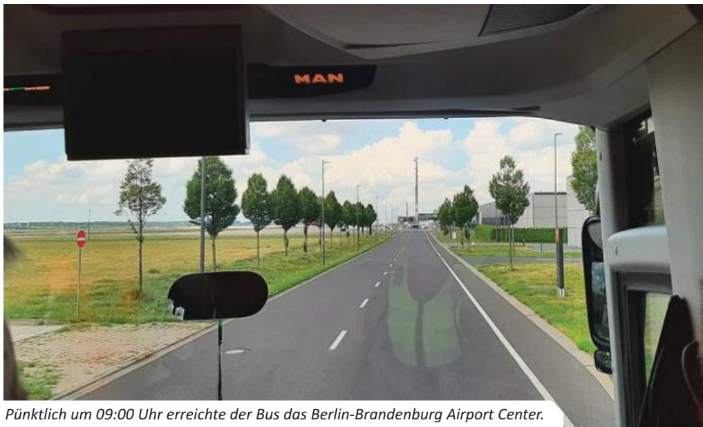
Pünktlich um 09:00 Uhr erreichte der Bus das Berlin-Brandenburg Airport Center.

Ein Besuch am Flughafen BER – in Brandenburg