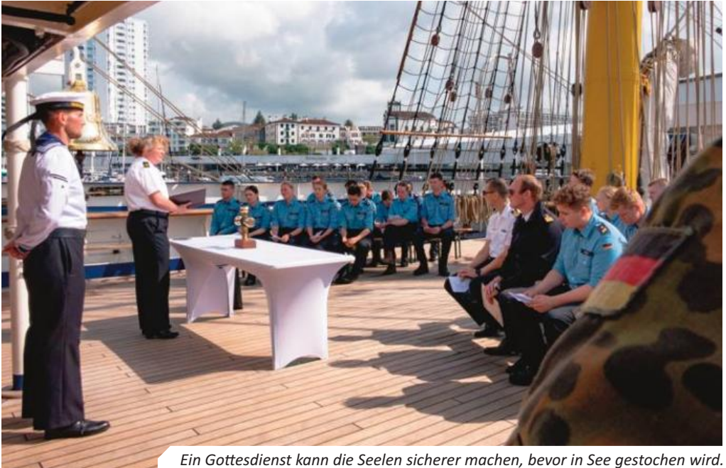
Ein Gottesdienst kann die Seelen sicherer machen, bevor in See gestochen wird.

Seewachen kennen. Zudem gab es, bevor wir in See stachen, auch einen Gottesdienst, an dem jeder Soldat, wenn ihm danach war, gerne teilnehmen konnte. In diesem Gottesdienst wurden Lieder gesungen, kleine Vorträge gehalten und natürlich gebetet. Viele fühlten sich dadurch sicher und waren in ihrem Gewissen reiner, wenn sie mit der Hilfe Gottes in See stachen. Am Hafen waren auch noch Aufgaben wie die Nahrungsübergabe zu erledigen sowie den Müll zu entsorgen, den man an Bord hatte.