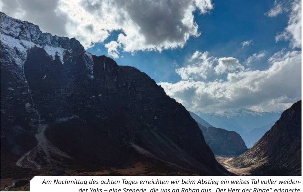
Am Nachmittag des achten Tages erreichten wir beim Abstieg ein weites Tal voller weidender Yaks – eine Szenerie, die uns an Rohan aus „Der Herr der Ringe“ erinnerte.

Schneesturm fegte über das Tal. Innerhalb von Minuten mussten wir uns umziehen und aufbrechen, bevor der Schnee zur zusätzlichen Belastung wurde. Die folgenden Tage führten uns überwiegend bergab in Richtung Flughafendorf Juphal. Landschaftlich fühlte es sich fast an, als wären wir plötzlich in Kanada gelandet. Insgesamt legten wir etwa 160 Kilometer zurück: eine Strecke, die durch ständige Auf- und Abstiege von mehreren hundert Höhenmetern, teils über 1.000 Höhenmeter pro Tag, deutlich anspruchsvoller war als es die reine Distanz vermuten lässt. Am Ende erreichten wir den Flugplatz und verbrachten die letzte Nacht in einem kleinen Hotel, wo wir unser erfolgreiches Abenteuer feierten. Endlich gab es wieder Momos: die traditionellen gefüllten Teigtaschen, von denen wir die ganze Tour über gesprochen hatten. Dazu ein verdientes Bier – ein perfekter Abschluss. Am