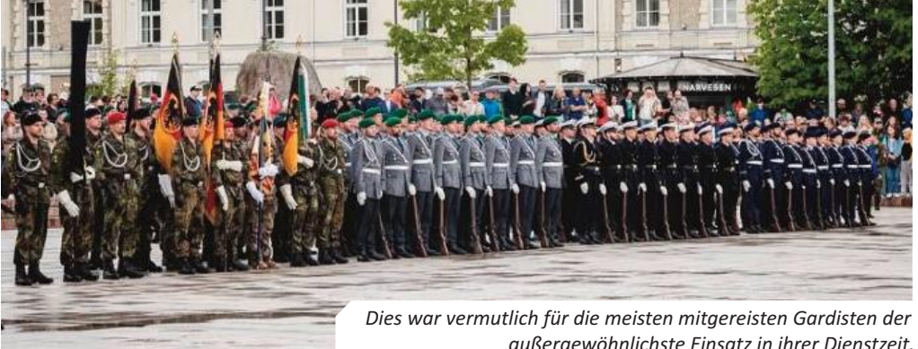
Dies war vermutlich für die meisten mitgereisten Gardisten der außergewöhnlichste Einsatz in ihrer Dienstzeit.

Vilnius zu fahren und dort unsere Lunchbeutel für den Tag zu erhalten. Die litauischen Lunchbeutel sind mit den deutschen vergleichbar. Jeder möge hier also zum Beschreiben der Qualität ein Adjektiv seiner Wahl einfügen... Die Teile der Brigade, die bei dem Appell mit auf dem Domplatz stehen sollten, wurden dort den ganzen Morgen nochmal in den Grundlagen des Formaldienstes aller Truppen