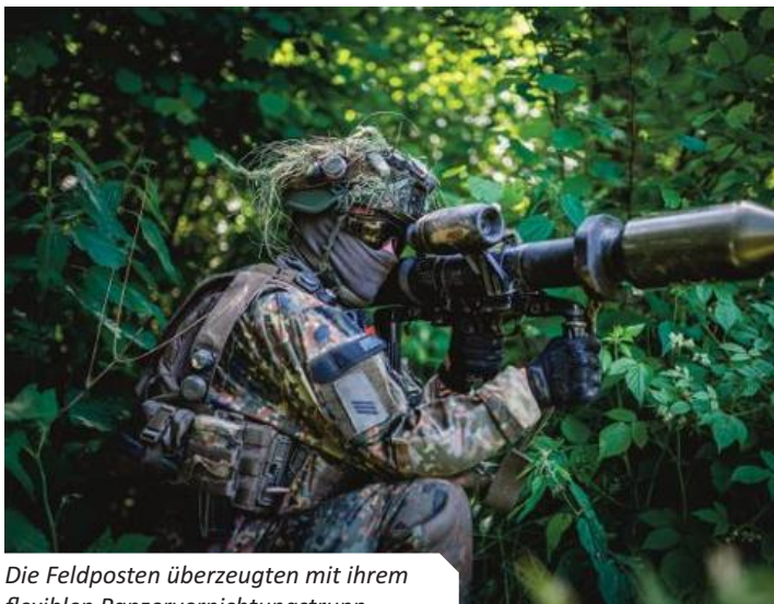
Die Feldposten überzeugten mit ihrem flexiblen Panzervernichtungstrupp.

kenntnissen für die eigene Operationsführung auf allen Ebenen.