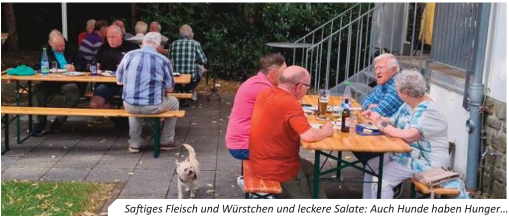
Saftiges Fleisch und Würstchen und leckere Salate: Auch Hunde haben Hunger...