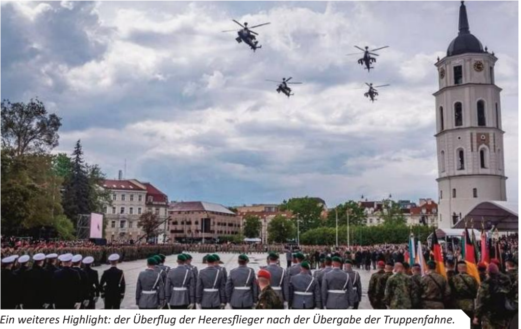
Ein weiteres Highlight: der Überflug der Heeresflieger nach der Übergabe der Truppenfahne.

zum Abendessen gedauert. Angekommen im Hotel, war der Schwerpunkt klar: Protpflege! Die Paradeanzüge sind durch die Reise als Handgepäck im Flugzeug zwar nicht arg in Mitleidenschaft gezogen worden, ein Bild gemäß „Semper talis“ haben sie jedoch nicht mehr abgegeben. Nach getaner Arbeit bot sich wieder die Gelegenheit, Vilnius zu erkunden.