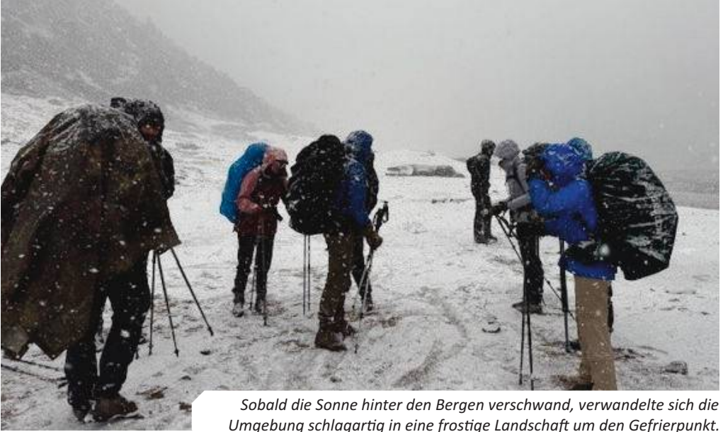
Sobald die Sonne hinter den Bergen verschwand, verwandelte sich die Umgebung schlagartig in eine frostige Landschaft um den Gefrierpunkt.

althpoints, abgeben sollten. Mit dem Erreichen des Startpunktes (nahe dem Flugplatz Juphal) wandelte sich die Reise: Aus der langen Anfahrt wurde nun eine echte Expedition zu Fuß durch die Bergwelt Nepals. Steile Anstiege, schmale Pfade und immer neue Ausblicke begleiteten uns fortan – ebenso wie das Bewusstsein, dass jeder unserer Schritte eine Mission unterstützte, die weit über persönliches Abenteuer hinausging.