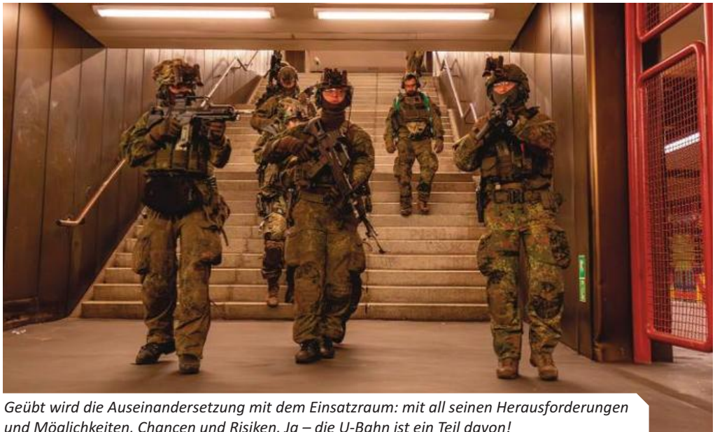
Geübt wird die Auseinandersetzung mit dem Einsatzraum: mit all seinen Herausforderungen und Möglichkeiten, Chancen und Risiken. Ja – die U-Bahn ist ein Teil davon!

und Beobachter anderer Verbände und Institutionen. Das Interesse an „Bollwerk Bärln III“ war nach den zuletzt durchgeführten Übungen sehr groß. Insbesondere die Umsetzung im Stadtgebiet Berlins sorgte für Aufsehen.