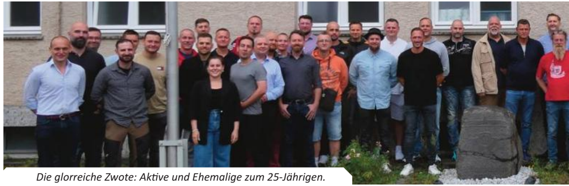
Die glorreiche Zwote: Aktive und Ehemalige zum 25-Jährigen.

Ein Treffen der besonderen Art in der zweiten Kompanie